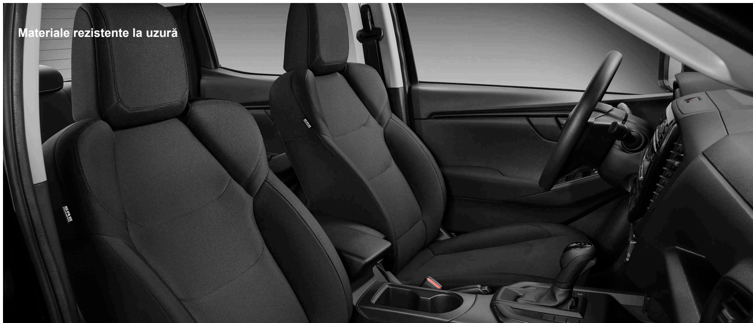
Materiale rezistente la uzură