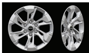
Jante din aliaj de 18” argintii (Style)