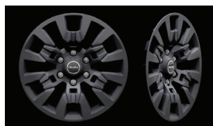
Jante din aliaj de 18” MATT DARK GREY (Executive)