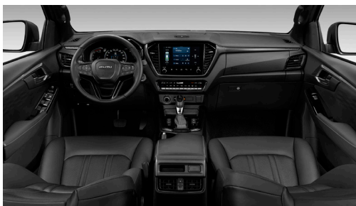
Black - Tapițerie din piele