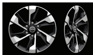
Jante din aliaj de 18” GREY MET cu finisaj mecanic (Premium)