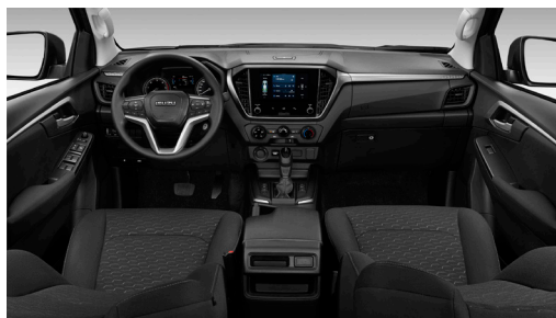
Black - Tapițerie din material rezistent la uzură